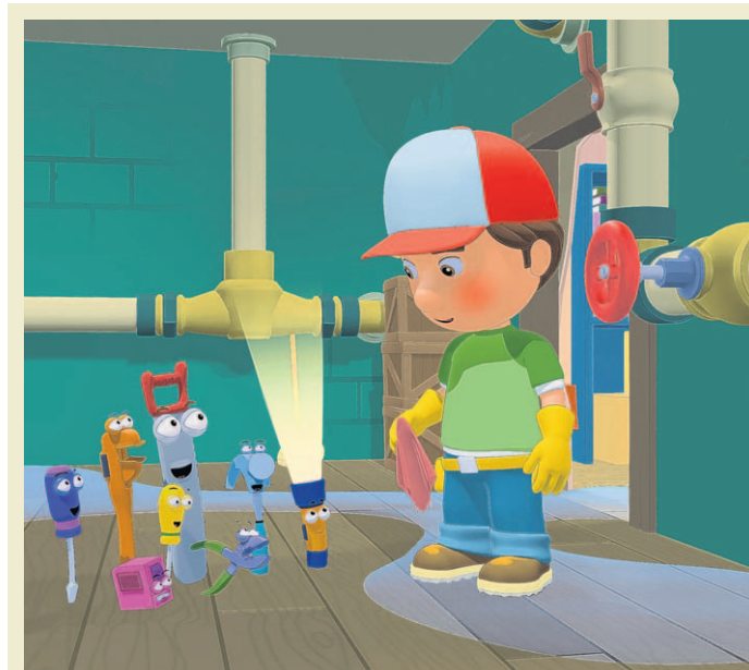
Meister Manny und seine kleinen Helfer. Sie wollen Kindern zwischen drei und sechs Jahren spanisch beibringen.

Der Disney Channel bei Premiere zeigt Meister Manny's Werkzeugkiste montags bis freitags um 7 Uhr, samstags und sonntags um 8 Uhr sowie mehrmals täglich im Playhouse Disney. ( www.disneychannel.de ).